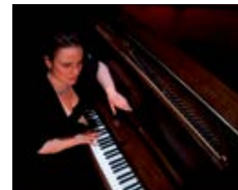
© Joel Lacire- Women & Song de Susy Firth